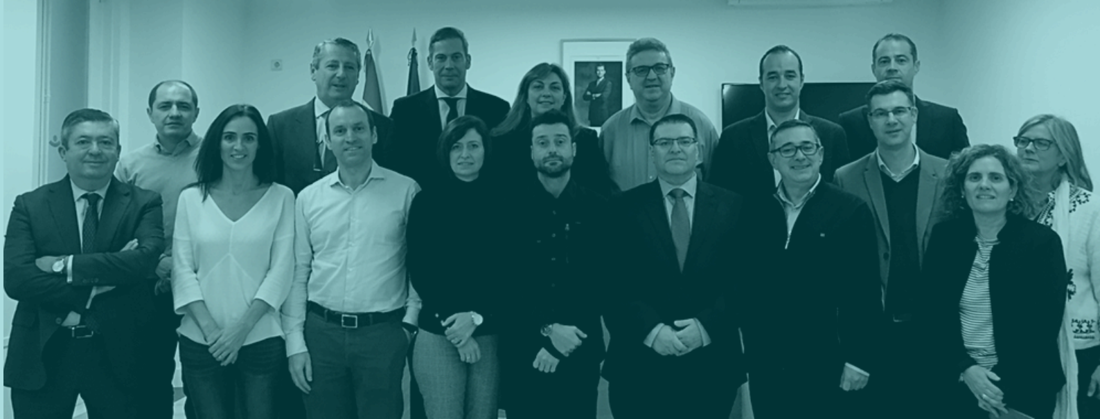
Alumnos de la I promoción