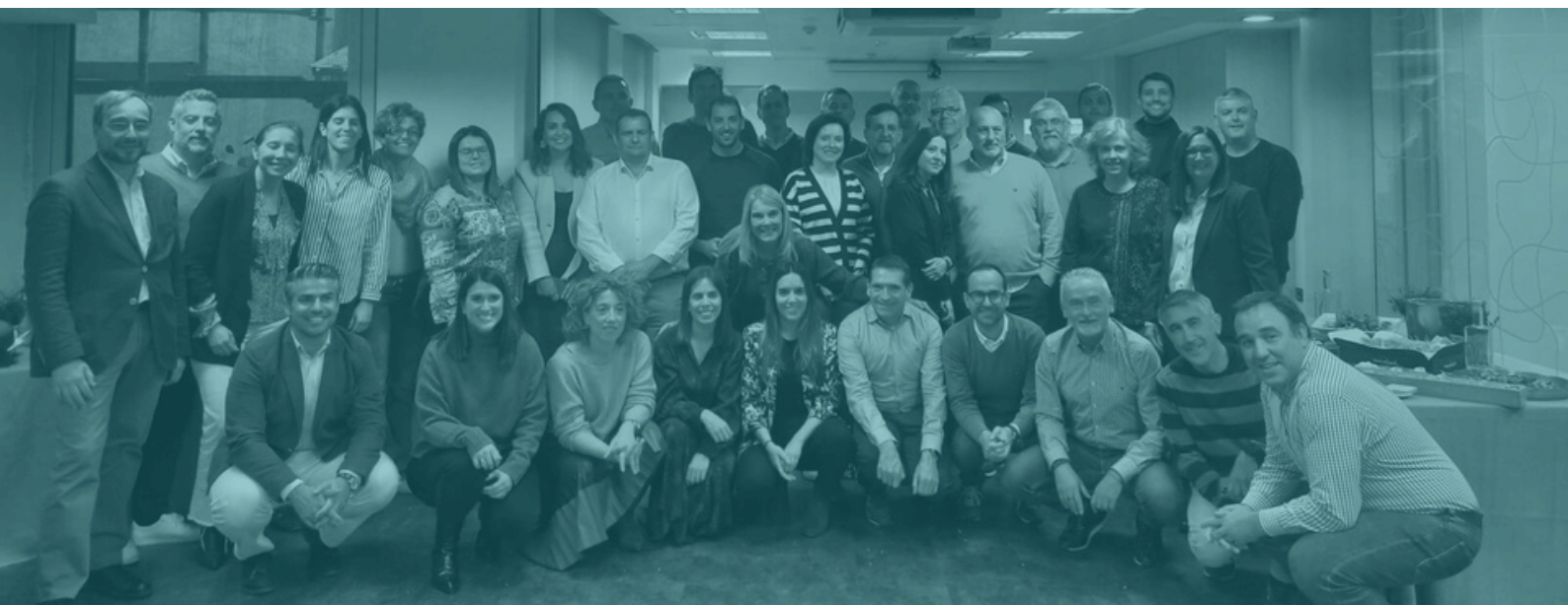
Alumnos de la VII promoción