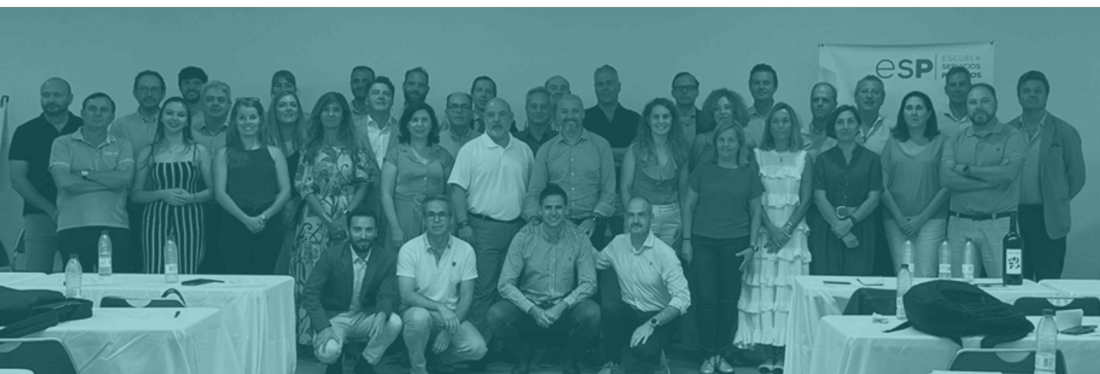
Alumnos de la V promoción